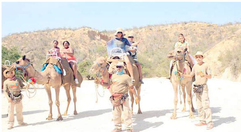
Turo su kupranugariais metu