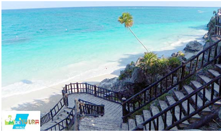
Tulum miesto Meksikoje vaizdas