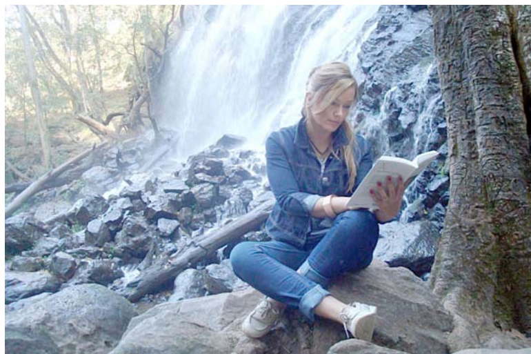
Rita Valle de Bravo miesto apylinkėse

– Ko, jūsų nuomone, netenka, ko nepamato, ką praleidžia siekdami kuo daugiau pamatyti svetimose šalyje tie, kurie pasirenka visą savo