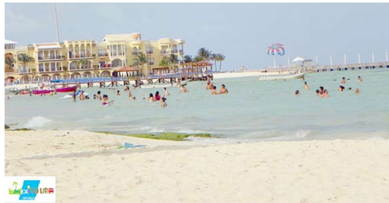
Playa del Carmen miesto vaizdas

laiką Meksikoje praleisti uždara-me kurorte?