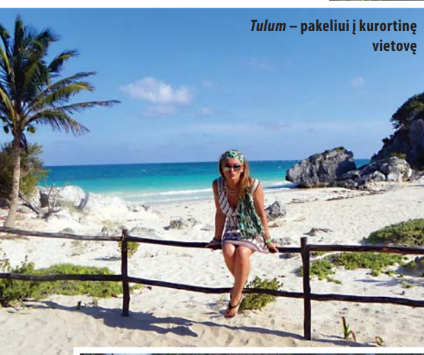
Tulum – pakeliui į kurortinę vietovę