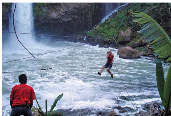
Atrakcijos prie krioklio