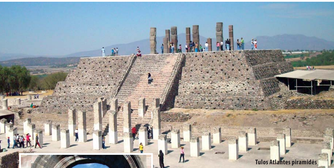
Tulos Atlantes piramidės