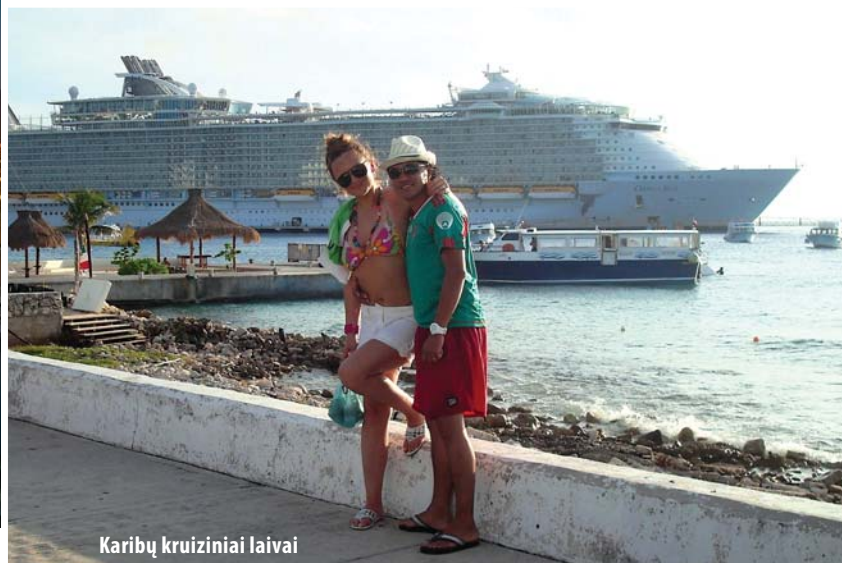
Karibų kruiziniai laivai

Meksikoje tėvai, ypač motina, labai gerbiami. Nors šalyje svarbiausius postus užima vyrai, tačiau valdžioje yra ir moterų. Varginingos šeimos iki šiol gimdo po 10 vaikų ir gyvena iš valstybės skiriamų pašalpų. Jiems tai apsimoka, nes neturint išsilavinimo neįmanoma rasti darbo. Pasiturinčios šeimos augina maždaug po tris vaikus. Girtuoklystė – labai retas reiškinys.