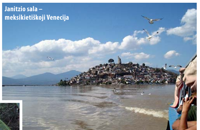
Janitzio sala – meksikietiškoji Venecija