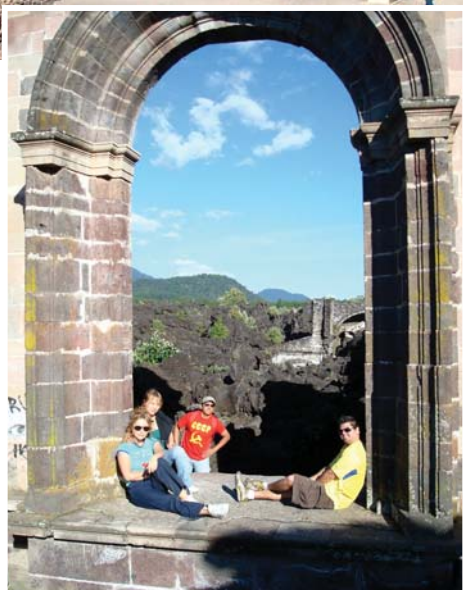
Paricutin – iš po lavos akmenų kyšo tik arka