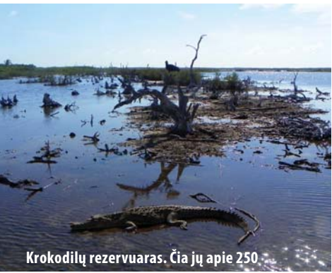
Krokodilų rezervuaras. Čia jų apie 250.