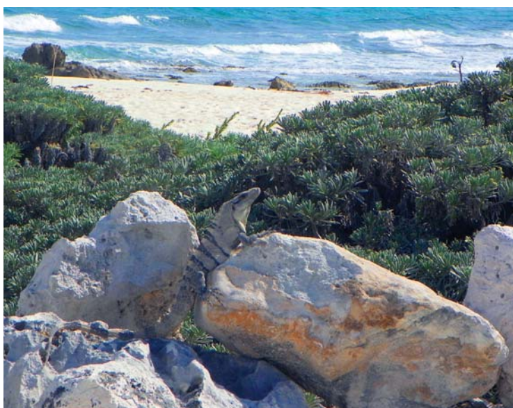
Iguana Cozumel saloje